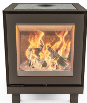
MAX B POOTJES