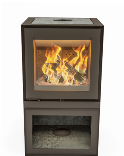
MAX B HOUTVAK